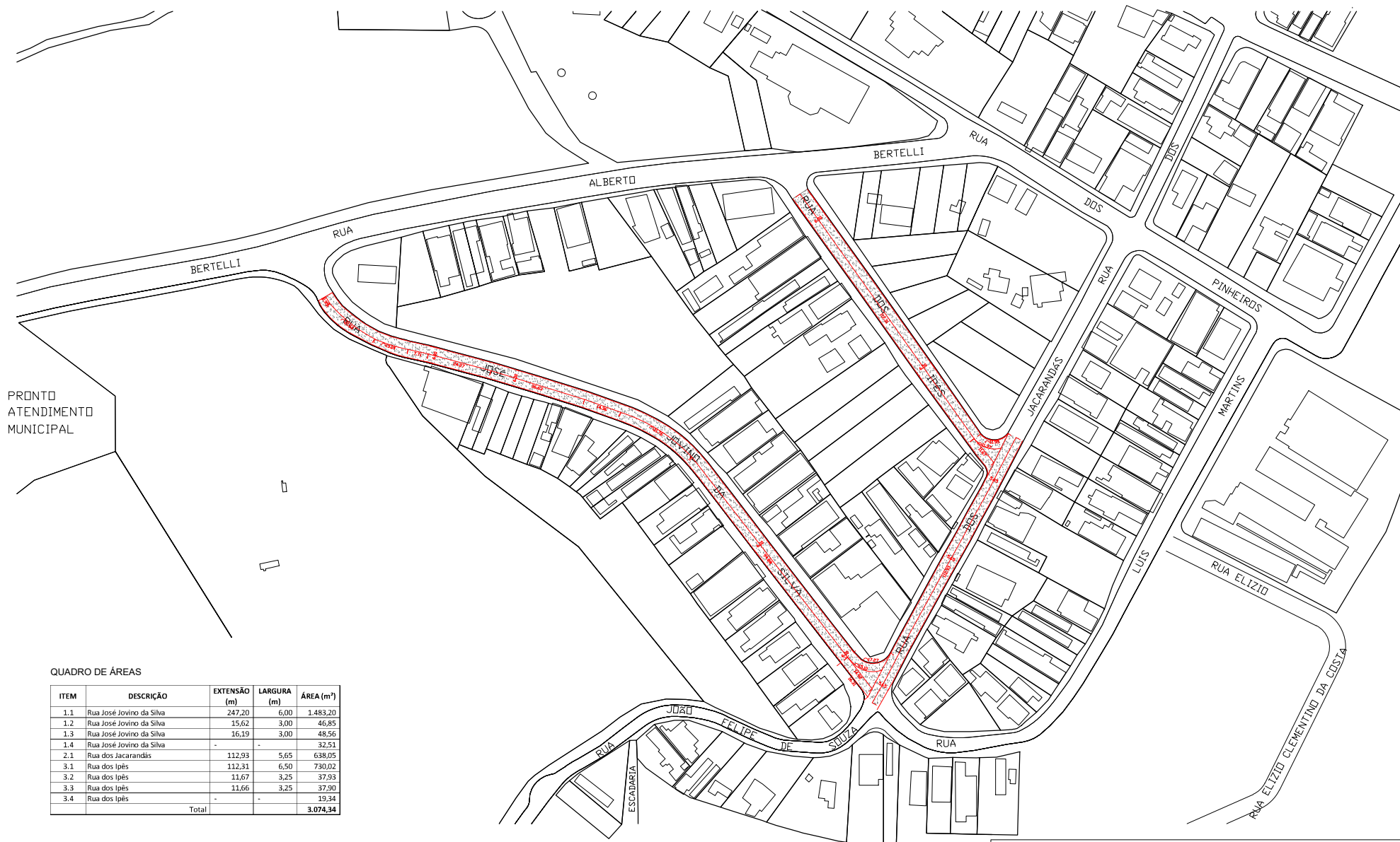
QUADRO DE ÁREAS