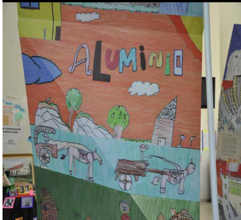
Trabalho em exposição no saguão da Prefeitura

O Projeto Memória Local na Escola, continua em exposição no Saguão da Prefeitura Municipal de Alumínio.